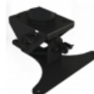
PAM-310 Instalación en techo para proyectores