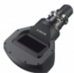
VPLL-3003 Objetivo de proyección para la serie VPL-F