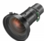
VPLL-Z3009 Objetivo con zoom de corto alcance